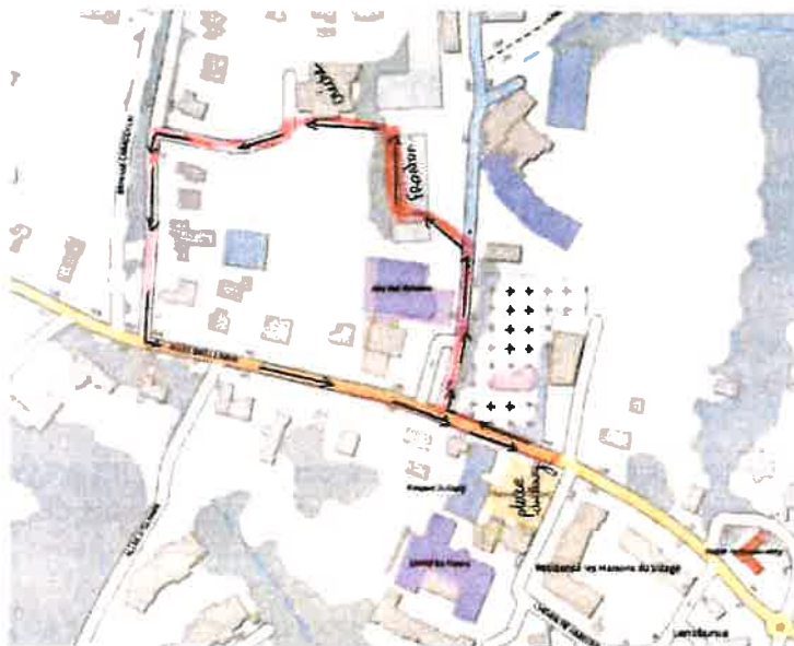
Annexe 1 – Plan - Défilé